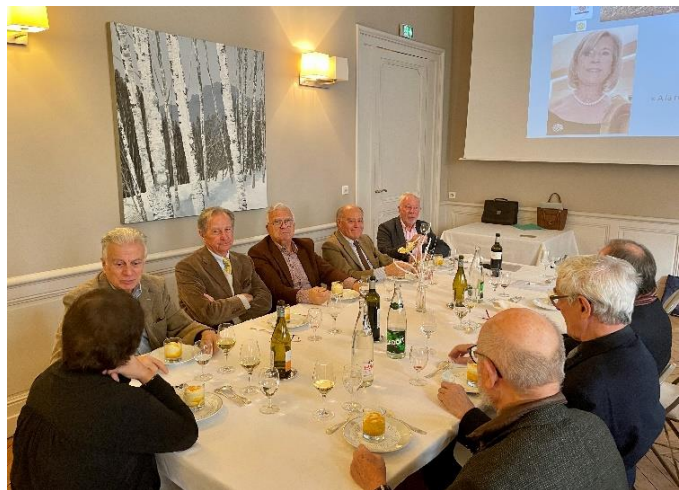
Nos membres présents à la réunion.