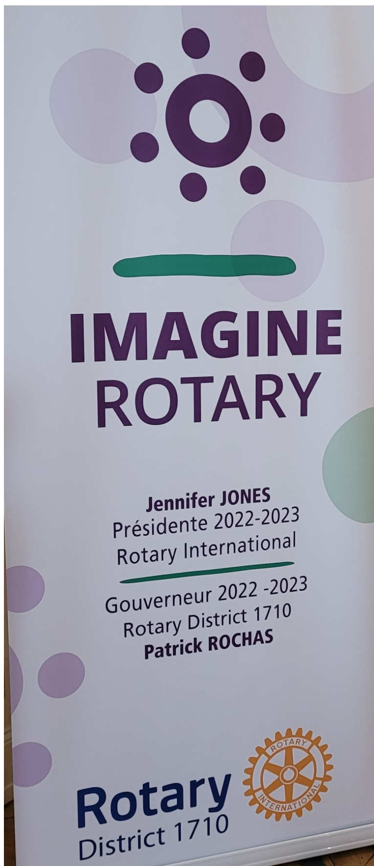
Le thème et les couleurs de l'année

Le fanion de l'année est vert pour l'écologie, blanc pour la paix et violet pour la polio.