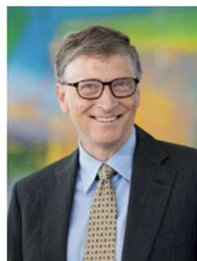
Bill Gates Fondation Bill et Melinda Gates

L'intervention de Bill Gates serait particulièrement pertinente pour mettre en exergue l'action particulière et décisive du Rotary pour l'éradication de la polio.